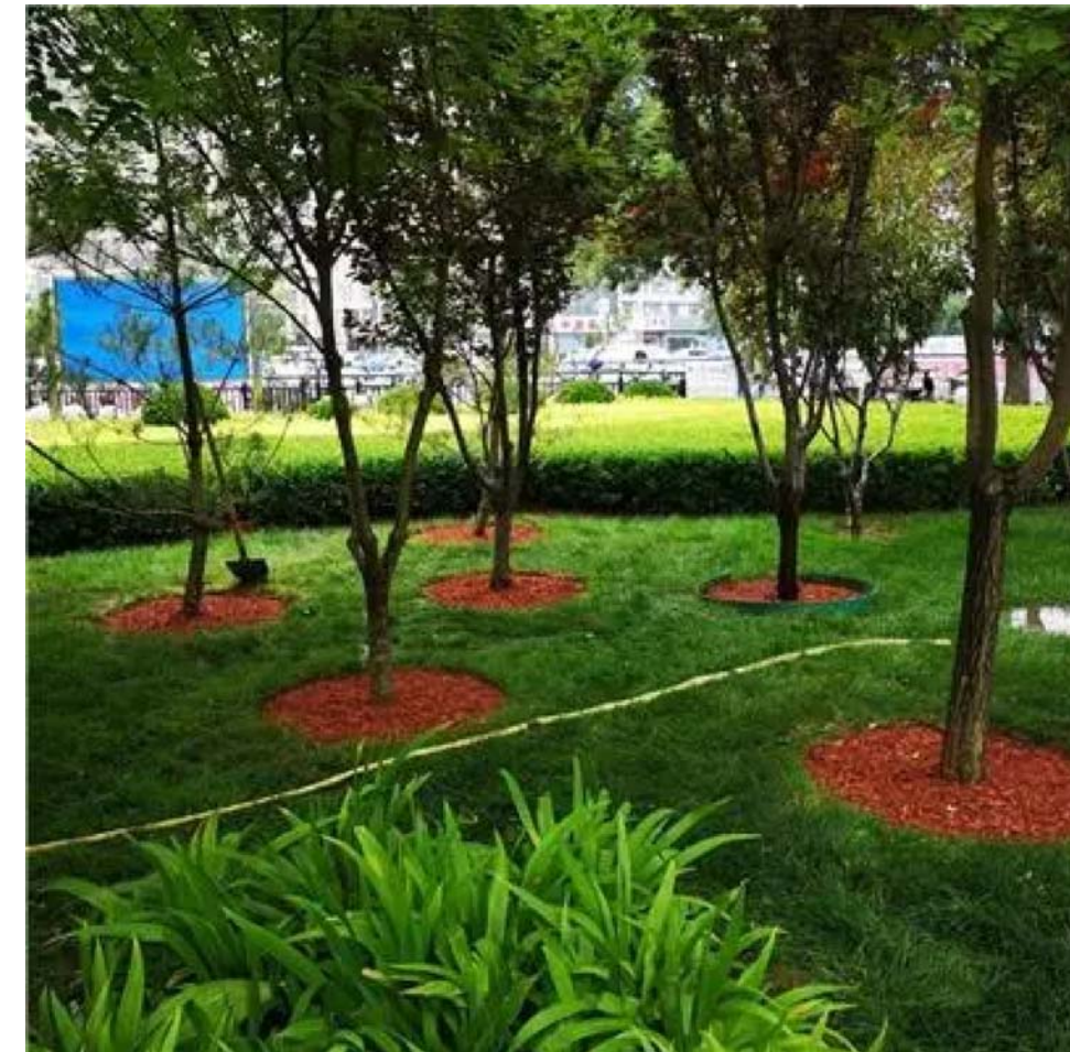
树穴有机覆盖物示意图